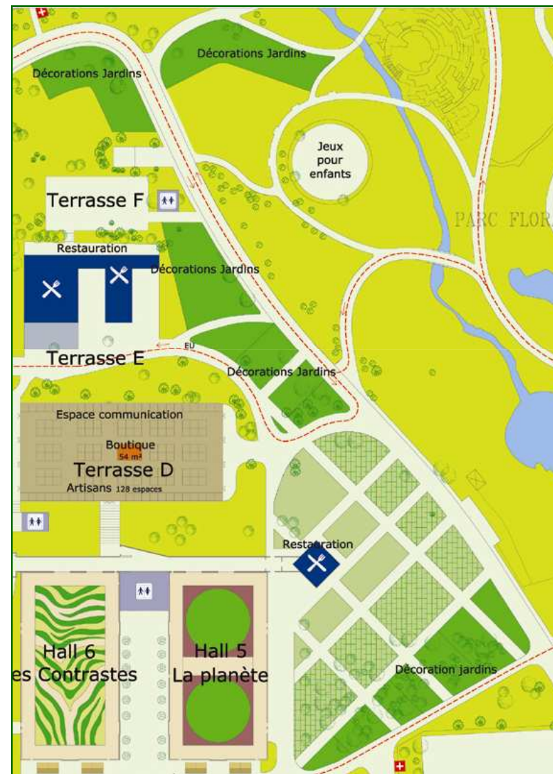
Plan partiel du site